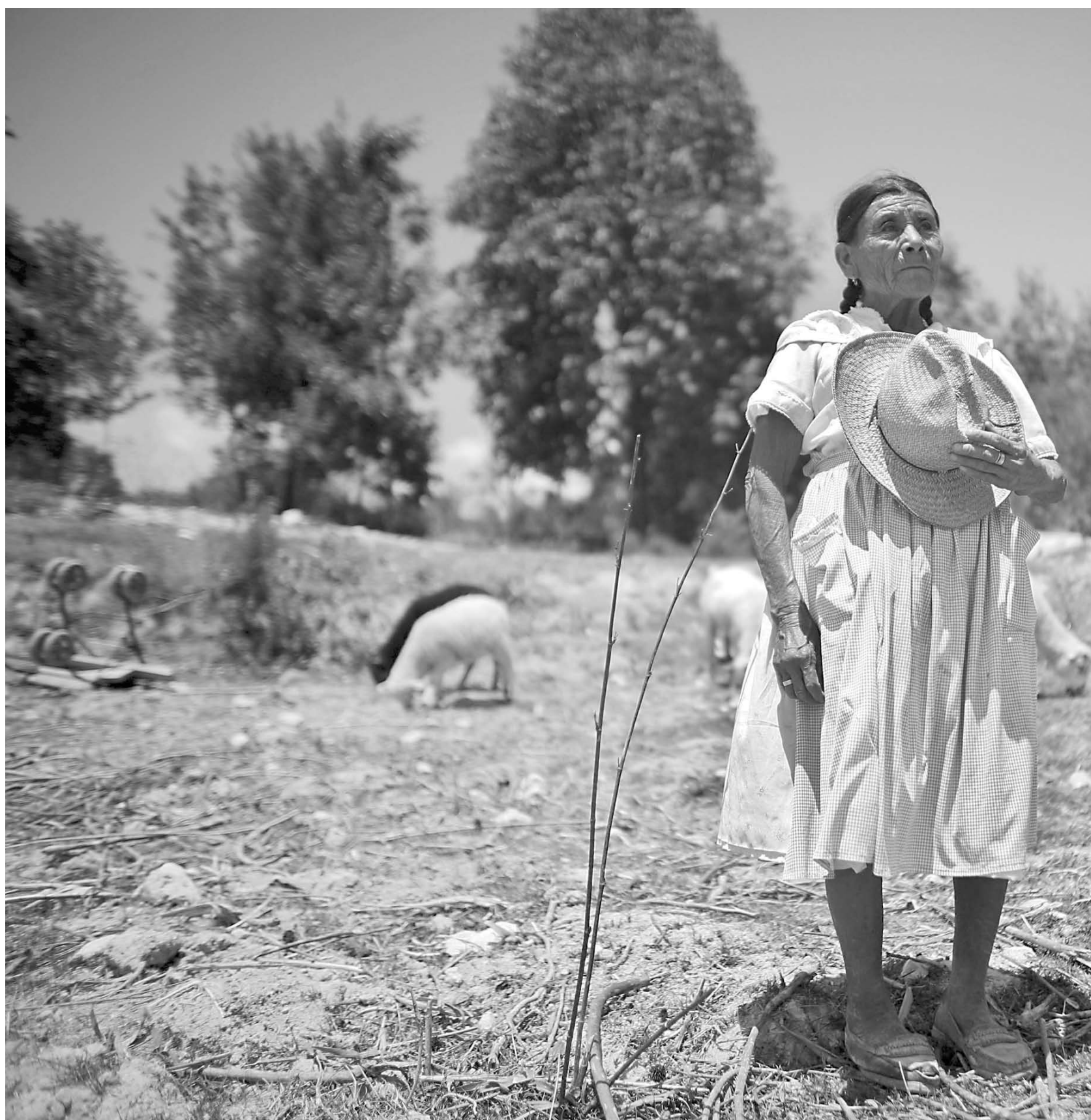
Se estima que 25 millones de personas en México viven en el sector rural y en las comunidades indígenas, donde la mayoría está en condiciones de pobreza, lo que provoca

A todo ello debe agregarse que, de acuerdo con las estadísticas de la Secretaría de Agricultura, Ganadería, Desarrollo Rural, Pesca y Alimentación (Sagarpa) y del Instituto Nacional de Estadística, Geografía e Informática (INEGI), hay en nuestro país casi cinco mil ejidos con problemas de invasión de terrenos y más de cinco mil 500 tienen ante sí dificultades provocadas por la erosión de los terrenos.